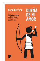
DUEÑA DE MI AMOR HERRERA, CORAL