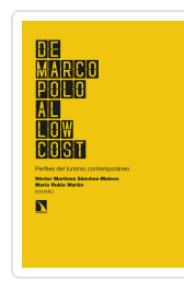
DE MARCO POLO AL LOW COST MARTÍNEZ SÁNCHEZ- MATEOS, HÉCTOR/RUBIO MARTÍN, MARÍA