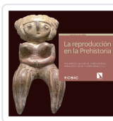
LA REPRODUCCIÓN EN LA PREHISTORIA VILA MITJÀ, ASSUMPCIÓ / ESTÉVEZ ESCALERA, JORDI / LUGLI, FRANCESCA / GRAU REBOL