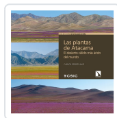
LAS PLANTAS DE ATACAMA PEDRÓS-ALIÓ, CARLOS