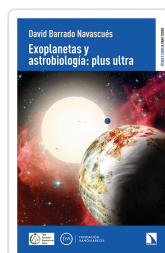
EXOPLANETAS Y ASTROBIOLOGÍA: PLUS ULTRA BARRADO NAVASCUÉS DAVID