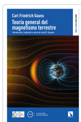
TEORÍA GENERAL DEL MAGNETISMO TERRESTRE FRIEDRICH GAUSS, CARL