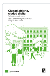
CIUDAD ABIERTA, CIUDAD DIGITAL CARLOS ARNAL, JOSÉ / SARASA, DANIEL