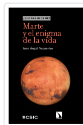
MARTE Y EL ENIGMA DE LA VIDA ÁNGEL VAQUERIZO, JUAN