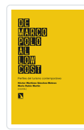
DE MARCO POLO AL LOW COST MARTÍNEZ SÁNCHEZ-MATEOS, HÉCTOR/RUBIO MARTÍN, MARÍA