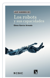
LOS ROBOTS Y SUS CAPACIDADES GARCÍA ARMADA, ELENA