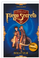
EL CLUB DEL FUEGO SECRETO / 4 BLANCO, DIEGO