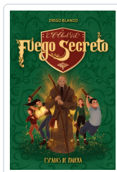
EL CLUB DEL FUEGO SECRETO / 2 BLANCO, DIEGO