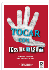
TOCAR CON PALABRAS LLADÓ MICHELÍ, ENRIC