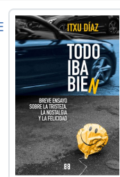
TODO IBA BIEN DÍAZ, ITXU