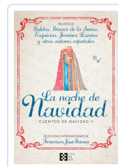
LA NOCHE DE NAVIDAD. CUENTOS DE NAVIDAD II GÓMEZ FERNÁNDEZ, FRANCISCO JOSÉ