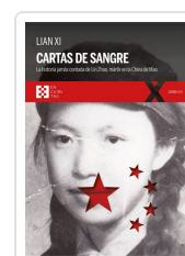
LIAN XI CARTAS DE SANGRE XI, LIAN