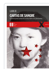
LIAN XI CARTAS DE SANGRE XI, LIAN