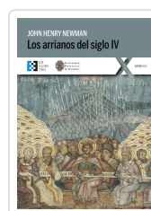
JOHN HENRY NEWMAN LOS ARRIANOS DEL SIGLO IV NEWMAN, JOHN HENRY