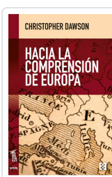
HACIA LA COMPRENSIÓN DE EUROPA DAWSON, CHRISTOPHER