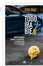
TODO IBA BIEN DIAZ, ITXU