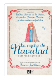
LA NOCHE DE NAVIDAD. CUENTOS DE NAVIDAD II GÓMEZ FERNÁNDEZ, FRANCISCO JOSÉ