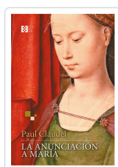
LA ANUNCIACIÓN A MARÍA CLAUDEL, PAUL