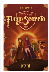
EL CLUB DEL FUEGO SECRETO / 3 BLANCO ALBAROVA, DIEGO