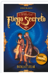
EL CLUB DEL FUEGO SECRETO / 4 BLANCO, DIEGO