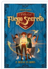
EL CLUB DEL FUEGO SECRETO / 1 BLANCO, DIEGO