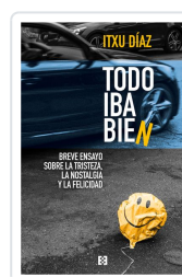
TODO IBA BIEN DÍAZ, ITXU