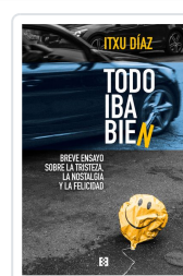
TODO IBA BIEN DÍAZ, ITXU