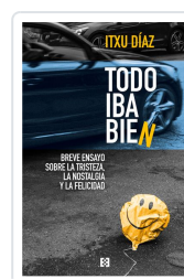
TODO IBA BIEN DÍAZ, ITXU