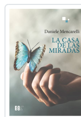
LA CASA DE LAS MIRADAS DANIELE MENCARELLI