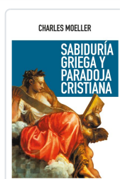
SABIDURÍA GRIEGA Y PARADOJA CRISTIANA MOELLER, CHARLES