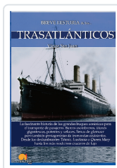
BREVE HISTORIA DE LOS TRASATLÁNTICOS SAN JUAN SÁNCHEZ, VÍCTOR