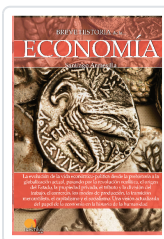
BREVE HISTORIA DE LA ECONOMÍA ARMESILLA CONDE, SANTIAGO JAVIER