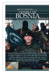
BREVE HISTORIA DE LA GUERRA DE BOSNIA SÁNCHEZ ARANAZ, FERNANDO