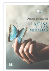
LA CASA DE LAS MIRADAS DANIELE MENCARELLI