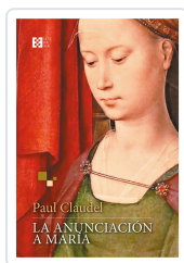
LA ANUNCIACIÓN A MARÍA CLAUDEL, PAUL