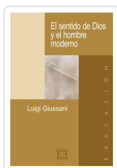
EL SENTIDO DE DIOS Y EL HOMBRE MODERNO GIUSSANI, LUIGI