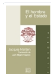
EL HOMBRE Y EL ESTADO JACQUES MARITAIN