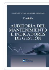
AUDITORÍA DEL MANTENIMIENTO E INDICADORES DE GESTIÓN. 2ª ED. FRANCISCO JAVIER GONZÁLEZ FERNÁNDEZ