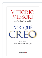
POR QUÉ CREO VITTORIO MESSORI