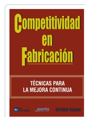
COMPETITIVIDAD EN FABRICACIÓN KIYOSHI SUZAKI