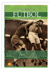
BREVE HISTORIA DEL FÚTBOL UYÁ ESTEBAN, MARCOS