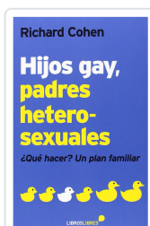
HIJOS GAY, PADRES HETEROSEXUALES COHEN, RICHARD