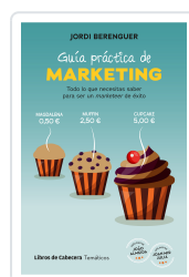
GUÍA PRÁCTICA DE MARKETING BERENGUER VALL-LLOBERA, JORDI