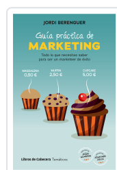
GUÍA PRÁCTICA DE MARKETING BERENGUER VALL-LLOBERA, JORDI