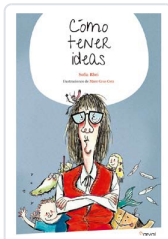
CÓMO TENER IDEAS RHEI, SOFÍA