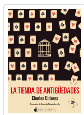
LA TIENDA DE ANTIGÜEDADES DICKENS, CHARLES