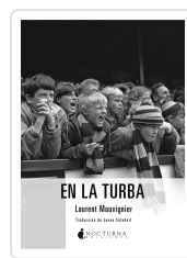
EN LA TURBA MAUVIGNIER, LAURENT