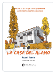
LA CASA DEL ÁLAMO YUMOTO, KAZUMI