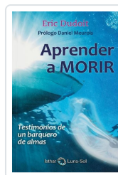
APRENDER A MORIR DUDOIT, ERIC