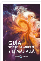
GUÍA SOBRE LA MUERTE Y EL MÁS ALLÁ DRON, NICOLE