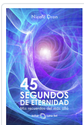
45 SEGUNDOS DE ETERNIDAD DRON, NICOLE