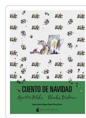
CUENTO DE NAVIDAD DICKENS, CHARLES