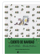
CUENTO DE NAVIDAD DICKENS, CHARLES