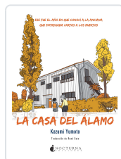
LA CASA DEL ÁLAMO YUMOTO, KAZUMI