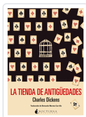
LA TIENDA DE ANTIGÜEDADES DICKENS, CHARLES