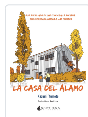
LA CASA DEL ÁLAMO YUMOTO, KAZUMI