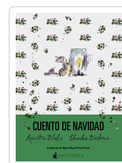
CUENTO DE NAVIDAD DICKENS, CHARLES