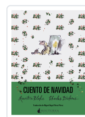
CUENTO DE NAVIDAD DICKENS, CHARLES