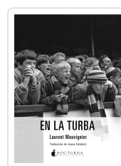
EN LA TURBA MAUVIGNIER, LAURENT