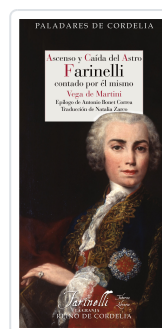
ASCENSO Y CAÍDA DEL ASTRO FARINELLI CONTADO POR EL MISMO MARTINI, VEGA