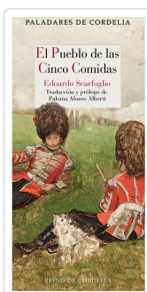
EL PUEBLO DE LAS CINCO COMIDAS SCARFOGLIO, EDOARDO