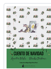
CUENTO DE NAVIDAD DICKENS, CHARLES