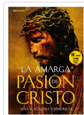
LA AMARGA PASION DE CRISTO (14ªED.) ANA CATALINA EMMERICH