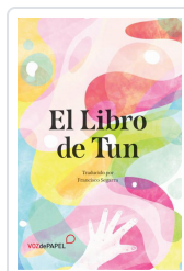
EL LIBRO DE TUN SEGARRA, FRANCISCO