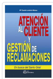
ATENCIÓN AL CLIENTE Y GESTIÓN DE RECLAMACIONES 2ª ED. Mª CLAUDIA LONDOÑO MATEOS