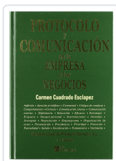
PROTOCOLO Y COMUNICACIÓN EN LA EMPRESA Y LOS NEGOCIOS. 7ª ED. CARMEN CUADRADO