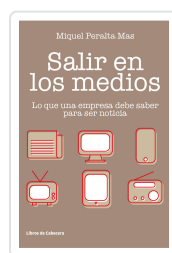
SALIR EN LOS MEDIOS PERALTA MAS, MIQUEL