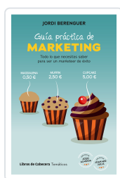
GUÍA PRÁCTICA DE MARKETING BERENGUER VALL-LOBERA, JORDI