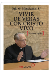
VIVIR DE VERÁS CON CRISTO VIVO LUIS M. MENDIZÁBAL