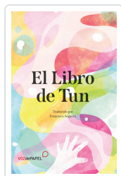
EL LIBRO DE TUN SEGARRA, FRANCISCO