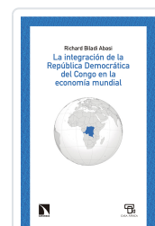
LA ECONOMÍA DE LA REPÚBLICA DEMOCRÁTICA DEL CONGO BILADI ABASI, RICHARD