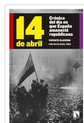
14 DE ABRIL CLAVERO MARTÍN, VICENTE