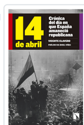
14 DE ABRIL CLAVERO MARTÍN, VICENTE