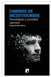
CAMINOS DE INCERTIDUMBRE PRADA, ALBINO