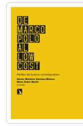
DE MARCO POLO AL LOW COST MARTÍNEZ SÁNCHEZ- MATEOS, HÉCTOR/RUBIO MARTÍN, MARÍA