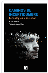
CAMINOS DE INCERTIDUMBRE PRADA, ALBINO